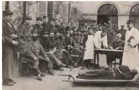
Un des hôpitaux militaires de Castres pendant la Grande Guerre : La Présentation