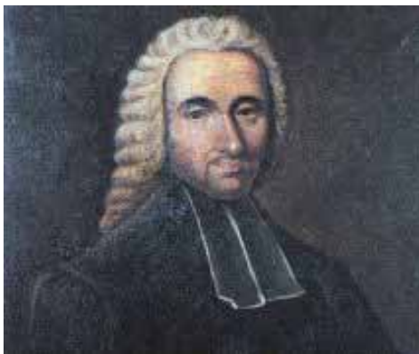
Le pasteur Paul Rabaut (1718-1794)

Après deux ans de recherches à Lausanne, Genève, Paris, dans les mairies et notariats de Camarès, Viane, Bédarieux et dans toutes les publications parues à ce sujet, j'avais pu commencer ma rédaction. Abandonnée le 4 août 1914, reprise en juin 1915, je pus au bout de trois mois terminer mon œuvre de trois cents pages que Fischbacher imprimera après la guerre 8 . Ce fut pour moi une grande joie de dresser ce petit monument à la mémoire du grand Apôtre du désert. C'en serait une aussi de voir mon volume circuler dans la librairie ; vivrai-je assez pour cela ?