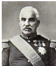
Maréchal Pélissier, duc de Malakoff (1794 – 1864)