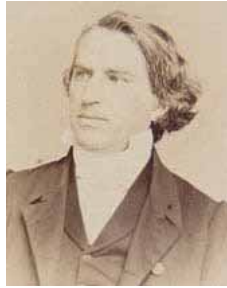
Auguste Bouvier (1826 – 1903)