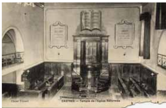
L'intérieur du temple avec trois médaillons à inscription