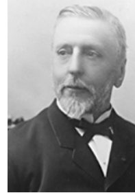
Edouard Barbey (1831 – 1905)

Ce ne fut que le 29 janvier 1878 que fut nommé Eugène Weyrich 47 que j'installai le 23 juin ; son ministère fut court, il mourut prématurément le 5 janvier 1891. Il laissait sept enfants et sa veuve à laquelle, spontanément, une souscription de huit mille livres fut versée. Six mois encore, je dus demeurer alors, seul, sur la brèche ; pénurie générale de pasteurs ; et pendant que j'en cherchais à tous les points de l'horizon, me survint la bonne aubaine de ma décoration : absolument à mon insu, les deux consistoires de Castres et de Mazamet s'entendirent pour solliciter pour moi cette faveur. Grâce à l'appui du sénateur Barbey 48 , j'entrai dans l'ordre de la Légion d'Honneur. Le décret fut signé le 25 juillet 1891 ; et le 28 août, dans un déjeuner de vingt convives de Mazamet et de Castres, la croix fut épinglée sur ma poitrine par le colonel Dardié, Commandeur. Son allocution, très vibrante, fut suivie de plusieurs autres, auxquelles je répondis. Mes trois enfants et mes petits-enfants étaient là et la