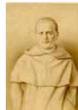
Père Henri-Dominique Lacordaire (1802 –1861)