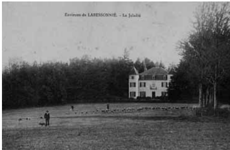
La Jaladié, commune de Montredon-Labessonnié