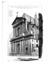
L'Oratoire du Louvre