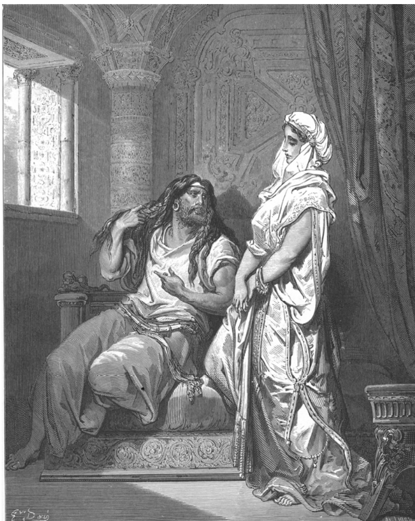
Samson et Delilah , gravure de Gustave DORÉ (1832-1883)

Dans le livre des Juges, le peuple philistin EspacesTemps1 apparaît comme l'adversaire majeur et comme un peuple impie (incirconcis) s'opposant aux tribus d'Israël. Samson, bien qu'attiré par des femmes philistines, pose plusieurs actes de bravoure contre les hommes philistins TextesBibliques16 avant la finale qui entraîne l'effondrement du temple.