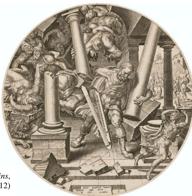
Samson détruit le temple des Philistins, gravure de Philips GALLE (1537-1612)

Mais le texte est peut-être plus équivoque. Car si on garde la traduction possible de "punir/condamner", la phrase " Samson jugea Israël pendant 20 ans " peut être aussi comprise de la manière suivante : " Samson punit Israël pendant 20 ans ". Il a tué des Philistins, mais il s'est aussi compromis avec eux : on n'oublie pas que sa première femme était philistine.